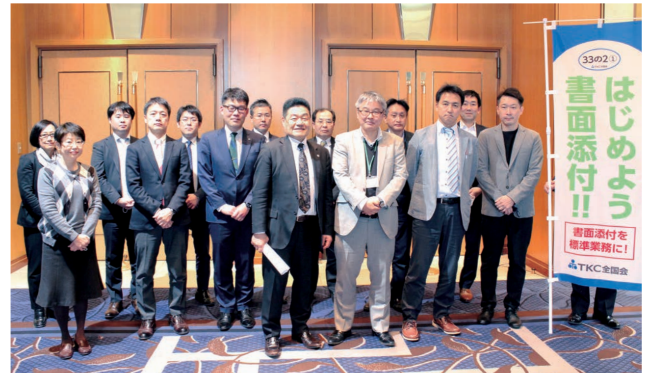
4月8日に開催された札幌西支部のランチ例会にて

発行責任者/田中 裕之 編集責任者/坂本 文彦 印刷所/株式会社メディアプラネット