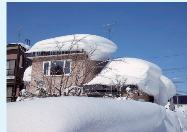
大雪に耐える建物