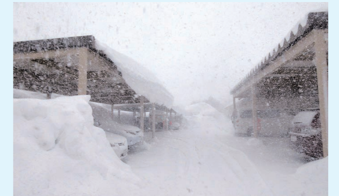
大雪の状況 3と同じ箇所の吹雪

すと、雪害による人的被害は53件で、雪下ろしや除雪中の事故や屋根からの落雪による事故、死者6人、負傷者47人となっています。また、建物の倒壊等も22件発生しています(空知総合振興局のまとめでも前年比大きく増加しているとのこと)。