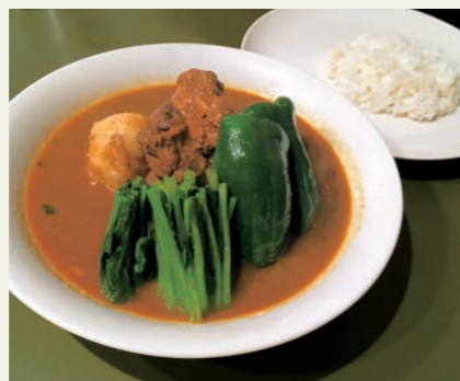
ラム・カレーにほうれん草