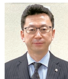
大和ハウス工業(株) 北海道支社 前支社長