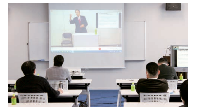
野垣会員の講演風景