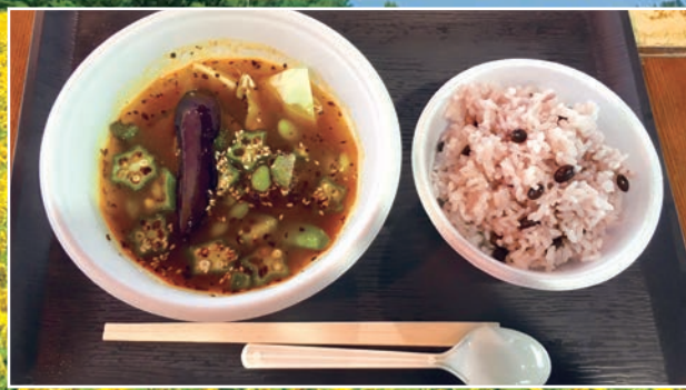
地元野菜と黒千石納豆のねばねばスープカレー黒千石大豆ご飯セット(北竜町ひまわりの里にて)