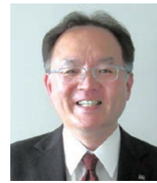
大同生命保険株式会社 北海道TKC企業支社 支社長