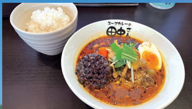
道内産肉付豚軟骨煮込みスープカレー、トッピングで幻の黒千石納豆と舞茸