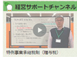
特例事業承継税制(贈与税)