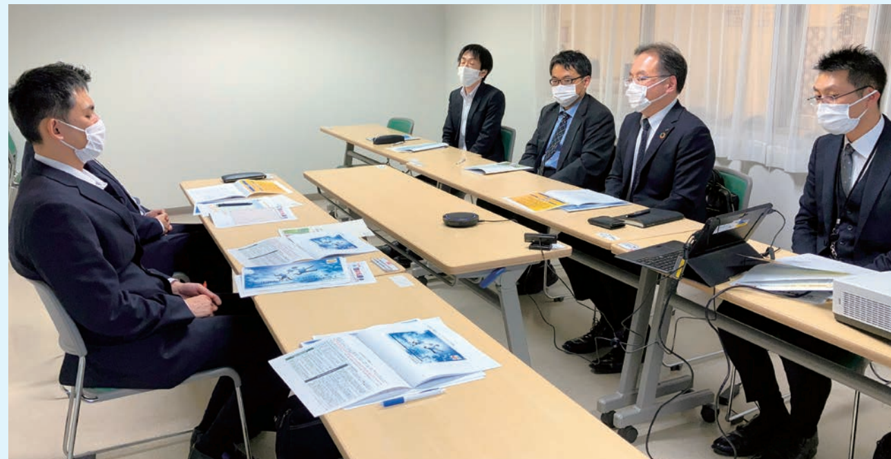
企業防衛制度推進友の会幹事会のようす