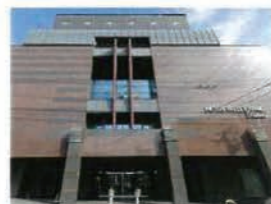
ホテル ベルクラシック北見