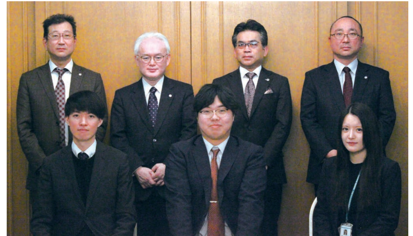
巡回監査士合格者座談会

発行責任者/本間 貴久 編集責任者/坂本 文彦 印刷所/株式会社メディアプラネット