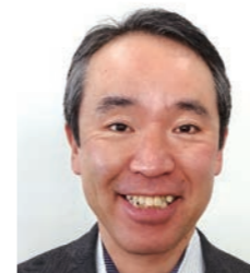
大同生命保険株式会社 北海道TKC企業保険 支社長