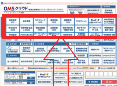
OMSクラウドメニュー 上段を活用すれば 事務所管理は万全!!

FMS(税理士報酬管理システム)とDRS(業務日報)による報酬と業務時間の把握を始めました。FMSとFX2との 仕訳連携 にて職員毎の収益についても、管理するようにしました。業務日報ではどの業務に時間を投下しているのかを把握するために業務体系も詳細に設定しました。その結果残業時間の一番少ない職員が売上をあげていることがわかり、一番多い職員の売上が少ないことがわかりました。そこで、一番少ない職員の仕事の取り組み方をモデルケースとして、業務日報に 「明日の予定」、「明日必ず終わらせる業務」、「見積時間と実際の投下時間の差異の原因」 を記載するように変更しました。スケジュールを活用することでお互いの業務スケジュールを把握できるようになり、業務の依頼がしやすくなるメリットがありました。OMSイントラネット、TKCチャットを活用することで所内の情報共有が効率的に行えるようになり、所内のコミュニケーションも円滑になりました。