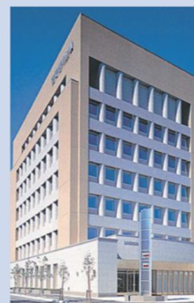
【空知信用金庫本店:写真HPより】